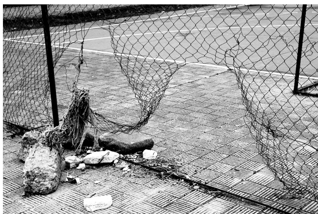
Juegos sin fronteras (Fotografía de Rodrigo Gómez Dávila , ganador de la III Edición) “I.E.S. Rodríguez Moñino” de Badajoz

Mientras, nos encontramos con los consabidos cruces de acusaciones entre las distintas administraciones sobre quién tiene la competencia para arreglar los desperfectos de los centros educativos. Con este Concurso de Fotografía esperamos vuestra participación y aportar nuestro granito de arena, su fin no es otro que subsanar las deficiencias existentes en nuestros centros al remover las conciencias de quienes tienen que poner los medios para mejorarlos y, a veces, suelen tardar en ello demasiado tiempo, jugando con el futuro de toda la comunidad escolar.